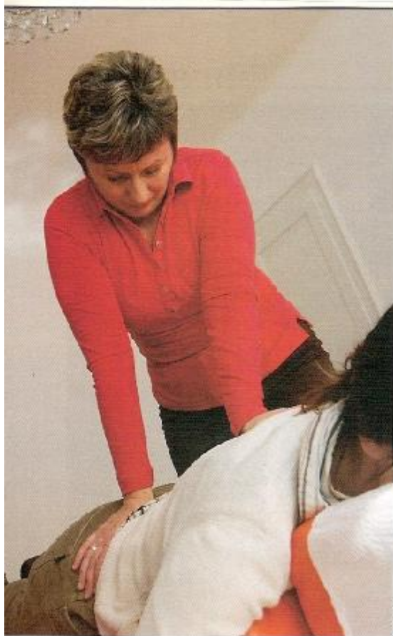
Del posega je tudi prijetna sprostitvena masaža.